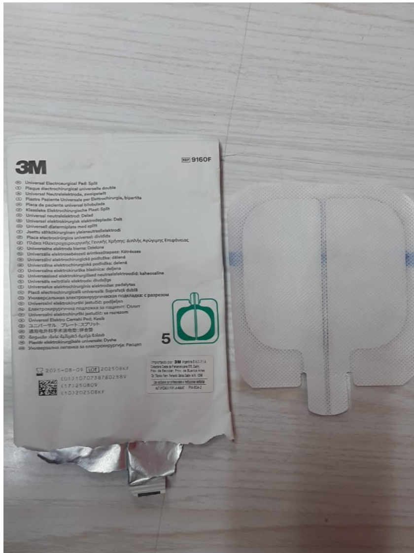
PLACA PACIENTE 3M