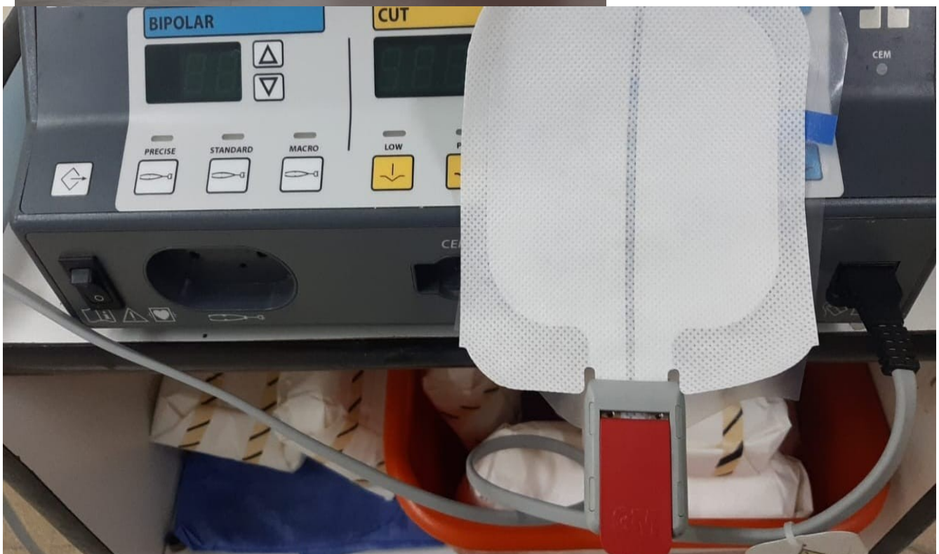
PLACA PACIENTE 3M INCERTADO EN CABLE 3M USADO EN QUIROFANO