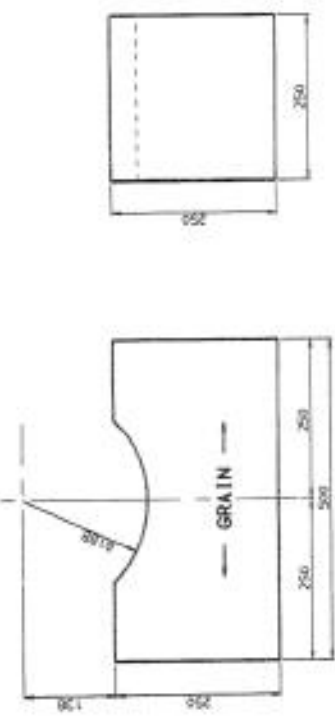
③ EXCITER SHAFT END SUPPORT.

NOTE - MINIMUM THICKNESS OF INDIVIDUAL TIMBERS = 50mm. NO NAIL HEADS OR OTHER FIXINGS TO BE ON RADIUSED SURFACE. HOOD TO BE FREE FROM ALL OBVIOUS DEFECTS. ALL BLOCKS TO BE PAINTED RED. ALL BLOCKS TO BE PERMANENTLY MARKED WITH TITLE IN ROTOR SADDLE. ALL BLOCKS TO BE PERMANENTLY MARKED WITH ROTOR WITHDRAMAL DRAWING REFERENCE. - DRAWING No. RB22922.