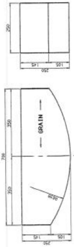
② STUB SHAFT SUPPORT 2.