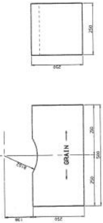
① STUB SHAFT SUPPORT 1.